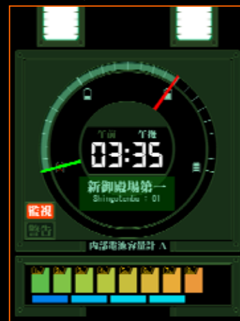
Eva・Stylish Power meter

携帯電話のバッテリー残量を開閉アクション、充電時等にパワーメーター風に表示します。中央にはデジタル時計機能を搭載。