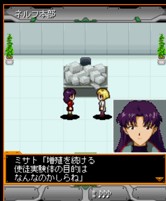
謎の多い「使徒実験体」。ミサト達に打つ手はあるのか？

ストーリーに沿って進める「 メインクエスト 」をはじめ、MAGIが各プレイヤー専用のクエストを自動生成する「 作戦クエスト 」、出撃場所が選択できる「 フリークエスト 」、他プレイヤーのアイテムを回収する「 回収クエスト 」など、遊びきれないクエストが待っている！