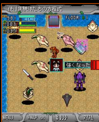
キャプチャーユニットで使徒を捕獲！

「 キャプチャーユニット 」で捕獲した使徒実験体は、マイルームで育成が可能！育成された使徒は特殊能力を覚え、自分のエヴァに同乗させることでエヴァの各能力が上昇したり、使徒特有の「 技 」が使用できるように！