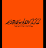
・画面は「エヴァンゲリオン新劇場版:序」「エヴァンゲリオン新劇場版:破」より