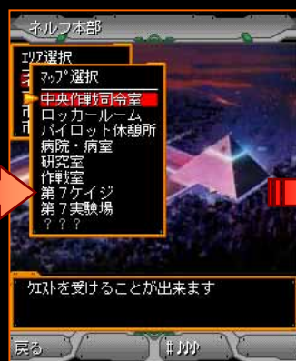
育成した使徒と一緒に出撃！