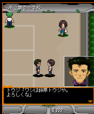
中学校に行くとうる原トウジ登場！意外と転校生にやさしい！？