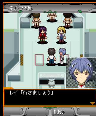
今回は綾波レイとパートナーになって出撃！