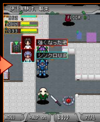
エヴァの各能力がアップしたり使徒特有の「技」が使えるように！