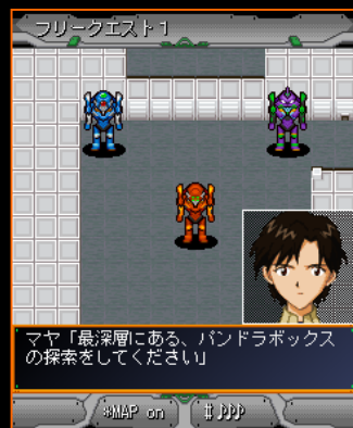
全国の仲間達と協力して、パンドラボックスの探索に出発！