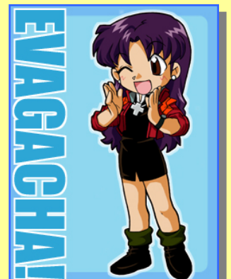
キャラクターデザインには、エヴァンゲリオンのデフォルメデザインに定評のある漫画家・イラストレーター藤田幸久氏を起用。