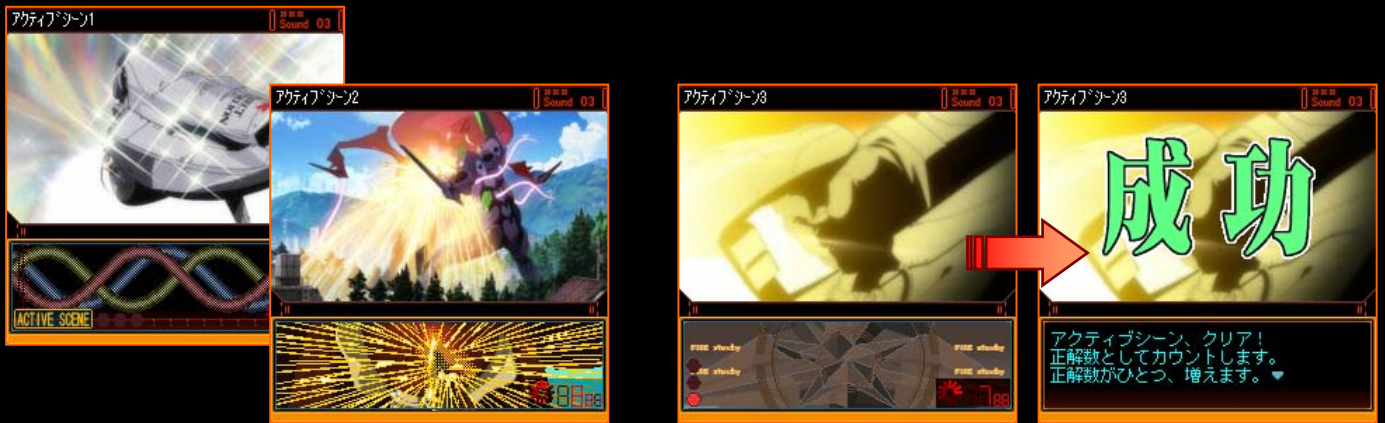
あの名場面が携帯電話で蘇る！

エヴァ新劇場版を見ていれば、いきなり与えられた任務も臨機応変に対応できるはず！？