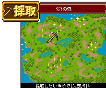
▲「採取」はミニゲーム