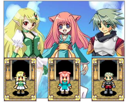
▲冒険者は「妖精族」「獣人族」「人間族」の3種族(男女)から選択可能

プレイヤーはまず最初に、珍しいモンスターや貴重な素材を見つけるのが得意な「妖精族」、モンスターとの戦闘が得意な「獣人族」、そして平均的な能力の「人間族」の中から自分の種族を決めて、その種族の「冒険者」になります。「冒険者」として各地で「依頼クエスト」を受けたり、「狩り」をしてアイテムの素材を集めたりしながら、「てのひらの大陸」を旅していくことになります。