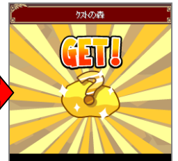
▲「採取素材」をゲットできる。その他にも大陸中には様々なお宝が眠っているかも？！