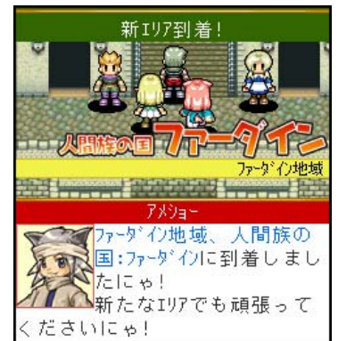
▲人間族の国「ファーダイン」到着！