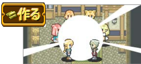
▲集めた素材を合成してアイテム作成！