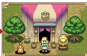
▲自分だけのお気に入りのマイショップにカスタマイズ