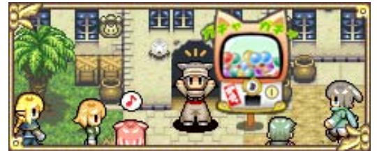
▲アメショー商会はいつも大繁盛！