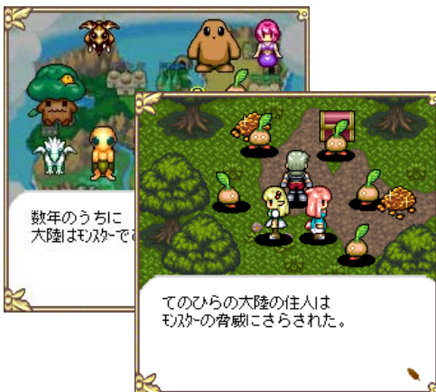
▲ファンタジー世界での冒険生活が始まる

冒険者となったプレイヤーは、大陸の各街にある「冒険者協会」で、困っている人々を助ける「クエスト」を受け、クリアしていくことでレベルを上げ、活動できるエリア、フィールドを広げていきます。また、モンスター達と戦う「狩り」や、各地に埋もれた素材を発掘する「採取」、集めた素材で強力な武器や防具等のアイテム作成、作ったアイテムを「マイショップ」で売る(※10月下旬以降配信予定)等、様々な楽しみ方が可能です。