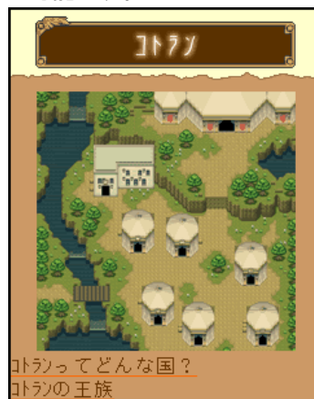
▲ディテールまでこだわった世界観がゲームを盛り上げる