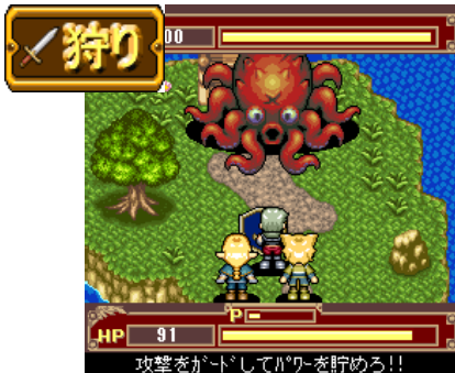
▲「狩り」で強敵が登場！

「てのひら★クエスト by GMO」では、素材を集めて合成して、さらに強力な武器や防具、アイテムなどを「作る」ことができます。「狩り」ではモンスターから得られるモンスター素材を、「採取」では「採取素材」を入手できます。「依頼クエスト」や「イベントクエスト」のクエストをクリアすることで入手できる「アイテムレシピ」を持っていると、これらの素材を合成して、さらに強力な武器や防具、アイテムなどを「作る」ことができます。ゲーム中に登場する素材、アイテムは全 400 種類以上を準備しています！（順次追加予定）