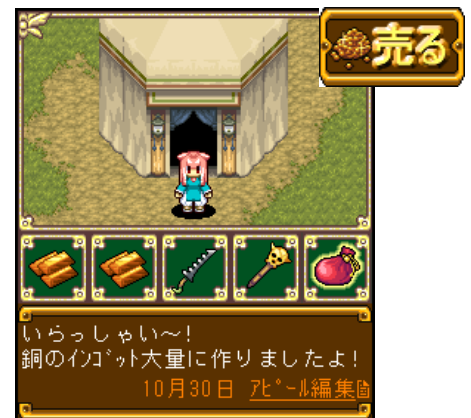
▲作成したアイテムは仲間や他の冒険者達に販売しよう！