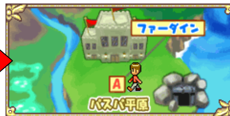
▲クエストをクリアすると行ける街や地域が増える！