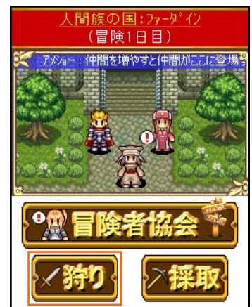
▲「街」から行動が選べる