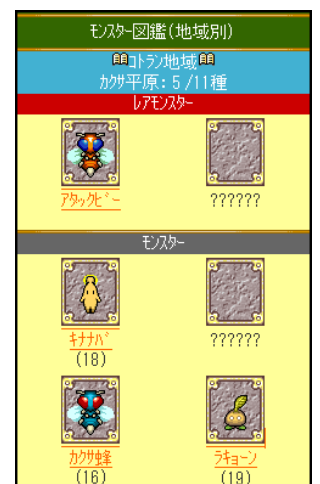
▲強敵を倒して「モンスター図鑑」をコンプリートしよう！