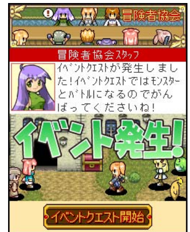
▲依頼クエストは街によって数も違い、内容もレベルに応じて様々

その街の「依頼クエスト」をすべて達成すると、強力なモンスターが登場する「イベントクエスト」が発生します。武器や防具などの装備を整えて、モンスターとの戦いに臨みましょう。「イベントクエスト」をクリアしていくことで「てのひらの大陸」の世界が広がっていきます。