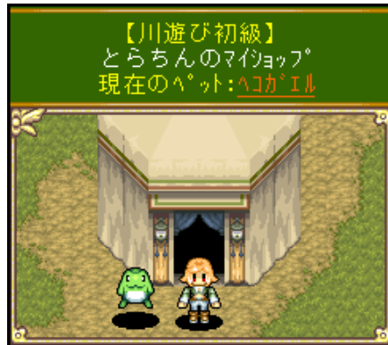
▲可愛いだけじゃない！飼育期間中は、一定期間ステータスがアップするなどの特殊効果が！