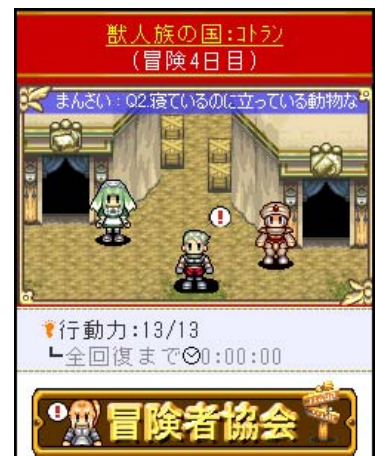
▲「冒険者仲間」が同じ街に居合わせることも！自己アピールが表示される

「てのひらの大陸」では、他のプレイヤーの冒険者と「狩り」や「採取」、「酒場」を通じて出会うことができます。他のプレイヤーと「冒険者仲間」になれば、戦闘時にパーティに加えることができます。また、仲間の人数に応じて自分のステータスが強化されるメリットも！ その他、仲間や他の冒険者と「握手」や「コメント」をすることで、「依頼クエスト」や「狩り」「採取」などの行動に必要な「行動力」が回復するといった、ソーシャルアプリならではの要素を備えています。冒険を有利にすすめるためにも、たくさん仲間を作りましょう！