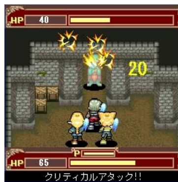
▲クリティカルアタック発動！仲間と力を合わせてモンスターを打ち倒せ！

モンスターには弱い「雑魚モンスター」から、なかなか姿を現さないが手強い「レアモンスター」まで、様々な攻撃パターン・特性を持ったモンスターが 200 種類以上登場する予定です。(※初期配信時 90 種類以上、順次配信)