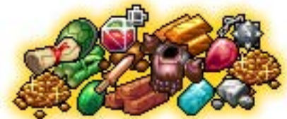
▲登場する素材・アイテムは 400 種類以上予定！